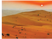
بیابان ربع الخالی، عربستان

نکته بیابان بزرگ عربستان، ربع الخالی در شبه جزیره عربستان حدود ۰۰۰٪ ۶۴ کیلومتر مربع یعنی تقریباً ۲/۵ برابر کشور انگلستان، وسعت دارد.